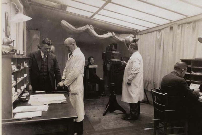
Oben: Blick in den Erkennungsdienst des Polizeipräsidiums Düsseldorf, 1920er Jahre

Die Kapitel vier und fünf, „ Die Verbrecher “ und „ Die Macht “, stellen die zentralen Veränderungen der Kriminalarbeit während des Nationalsozialismus gegenüber der demokratischen und rechtsstaatlichen Weimarer Republik vor. Dadurch, dass die Kriminalpolizei nun Menschen auch ohne konkrete Tat in sogenannte „Vorbeugehaft“ nehmen konnte, stellten die Häftlinge der Kripo bis Anfang der 1940er Jahre die Mehrheit der Insassen von Konzentrationslagern. In den Händen der Kriminalpolizei lag zudem die NS-Verfolgung der Sinti und Roma. Kapitel vier fragt außerdem nach der Rolle, die Frauen in der Kriminalpolizei und ihrer Verfolgungsarbeit spielten.